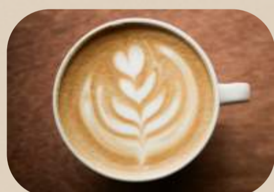
Cappuccino/Cappuccino cu frișcă