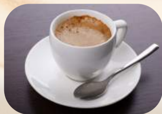
Espresso fără cofeină