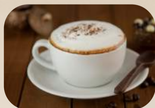
Cappuccino fără cofeină