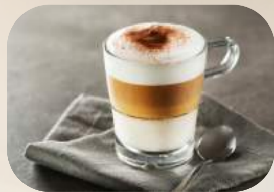
Cafea în 3 culori